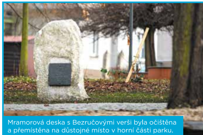
Mramorová deska s Bezručovými verši byla očištěna a přemístěna na důstojné místo v horní části parku.

Druhý památník nechal postavit tentýž spolek v roce 1937 při příležitosti oslav 70. narozenin Petra Bezruče, jednalo se o bronzovou bustu básníka s citátem básně „já“. Dochovala se mramorová deska s Bezručovými verši, památník byl očištěn a přemístěn na důstojné místo v horní části parku. Bezručův pomník byl původně umístěn při měšťanské škole na Baranovci a v roce 1939 přemístěn do sadu.