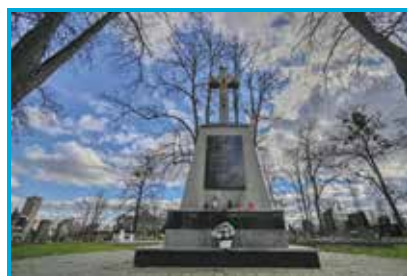
Rekonstruován bude 230 centimetrů vysoký kříž na hřbitově v Kunčičkách. Podle nápisu na desce na podstavci kříže byl postaven v roce 1907.

Na největším z ostravských hřbitovů v těchto dnech vzniká nová stavba technického zázemí. Bude sloužit pro uskladnění zahradní techniky a mechanizace správce hřbitova a pro parkování užitkových vozidel městského obvodu. Dále zde vzniknou šatny pro zaměstnance správy hřbitova (zvláště pro ženy a muže) a krytá oplocená plocha pro skladování drobného materiálu pro údržbu. Tato nová budova bude přistavena ke stávající správní budově hřbitova. Jedná se o nepodsklepenou jednopodlažní budovu s plochou střechou. Předpokládané náklady činí jeden a půl milionu korun.