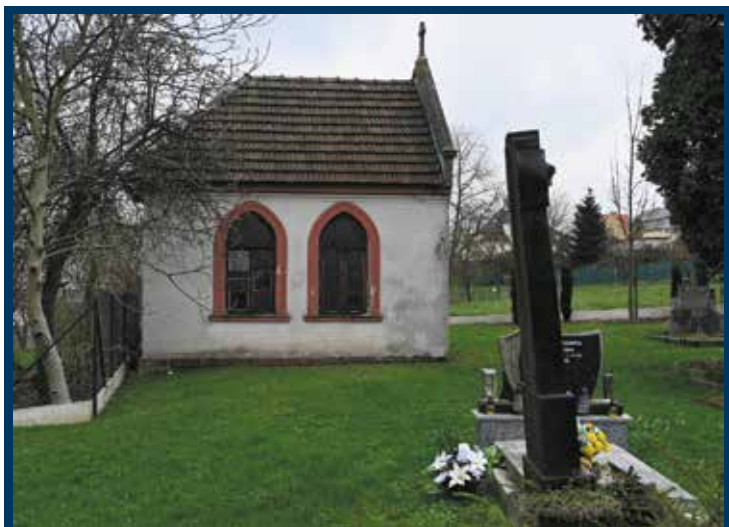
Na rekonstrukci čekající márnice v Heřmanicích.

Třetí akcí je „Rekonstrukce bývalé márnice na starém hřbitově v Heřmanicích“. Budova bude po rekonstrukci pronajata Římskokatolické farnosti Ostrava-Heřmanice, která v ní zřídí trvalou výstavu o historii Heřmanic, přístupnou v otevírací době hřbitova široké veřejnosti. Další akcí je „Vodovodní stojan a zpevněné plochy na starém hřbitově