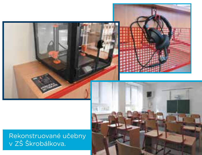
Rekonstruované učebny v ZŠ Škrobálkova.

Modernizace školních tříd je realizována z dotace Integrovaného regionálního operačního programu 2021-2027. Ve všech čtyřech základních školách Slezské Ostravy takto vznikne celkem devět nových učeben, vše bude stát zhruba 25 milionů korun. Přitom 21 milionů korun se Slezské Ostravě podařilo získat z evropských dotací.