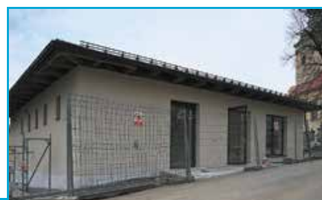
Stavba budovy technického zázemí na ústředním hřbitově.